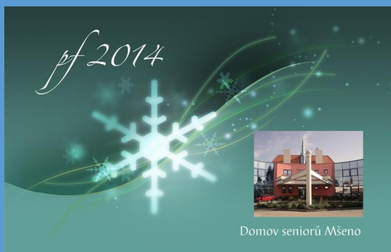
Domov seniorů Mšeno

Umění rané renesance v Itálii Dějiny oděvní kultury II.